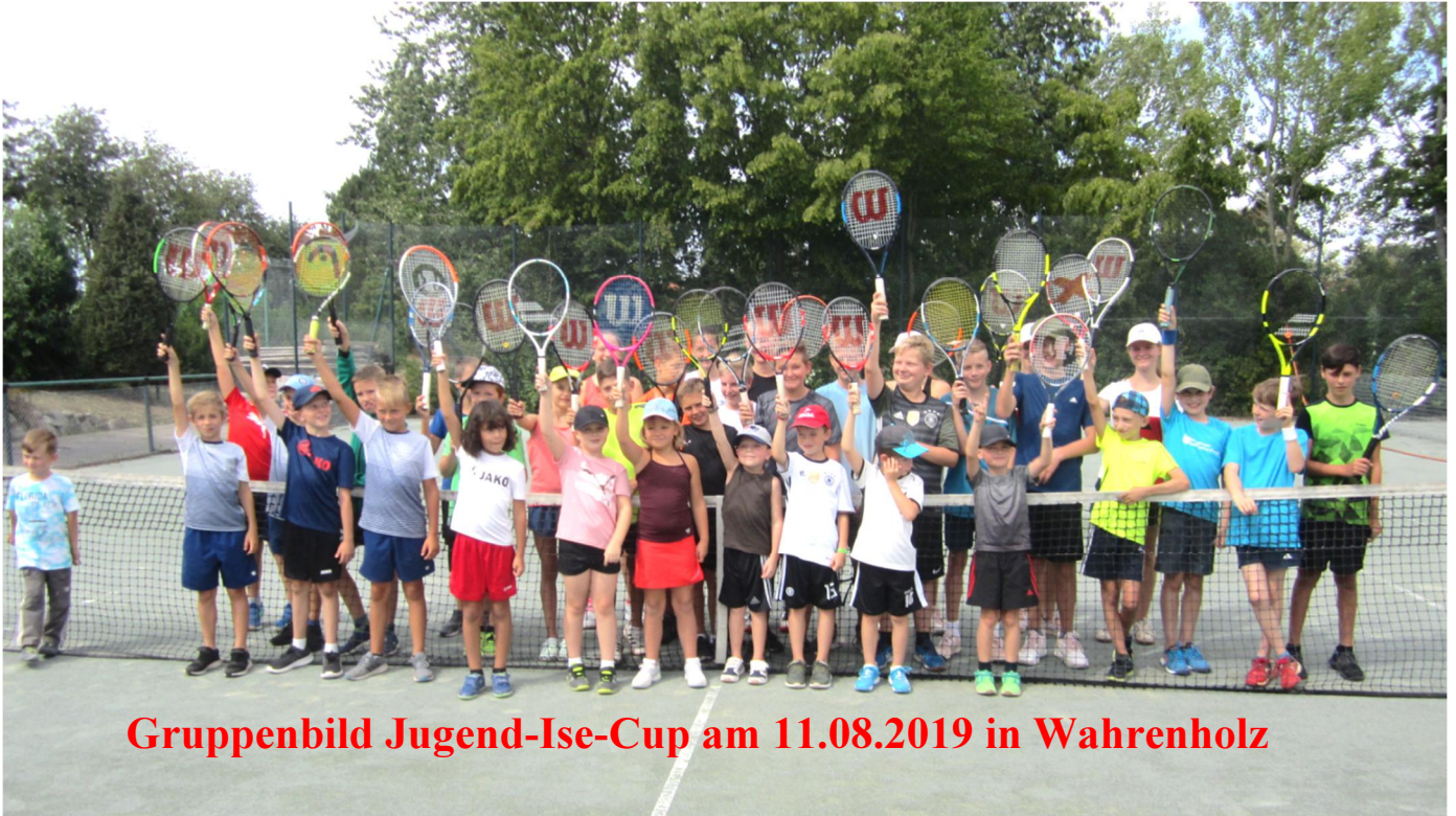
Gruppenbild Jugend-Ise-Cup am 11.08.2019 in Wahrenholz

2019 war der VfL Wahrenholz an der Reihe den nunmehr 8. Junioren Ise-Cup auszurichten. Insgesamt folgten 18 Doppel und somit 36 Kinder dieser Einladung und kamen im Taterbusch bei bestem Wetter zusammen. Die Kinder lieferten sich spannende Spiele und bereiteten nicht nur sich selbst, sondern auch den vielen Zuschauern einen gelungenen Tag! Nach fast 8 Stunden heiß umkämpfter Ballwechsel erfolgte die abschließende Siegerehrung mit Pokalen und Medaillen. Teilnehmende Vereine sind Hankensbüttel, Knesebeck, Radenbeck-Zasenbeck, Schönewörde, Sprakenshl, Wahrenholz und Wittingen.