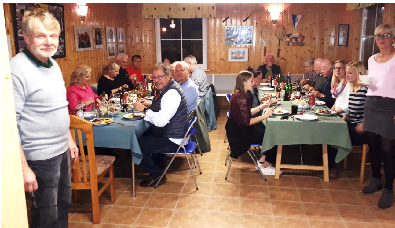
11.10.2019: Wildschweinessen zum Saisonabschluss im Tennisheim