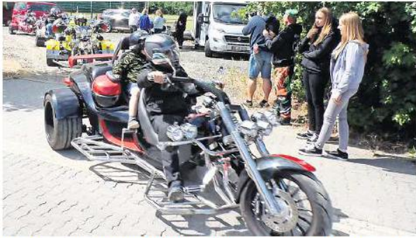
Abenteurer im Zeltlager: Die Jugendlichen und Kinder durften auch mit Quads und Trikes fahren.